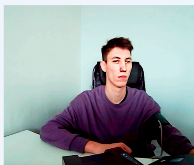
Измерение давления и пульса

Тестовый Водитель Компании прошел предрейсовый медицинский осмотр к исполнению трудовых обязанностей допущен 06-09-2023 13:44:29 (МСК) Медработник: Тест_Проверка Медика Тестовое представительство Лицензия №_ТестоваяЛицензия от 10-10-2020 г., бессрочно УКЭП 8ВВ5904375А359Е4 Осмотр № 1 6664633 МЕДБАНК.РФ