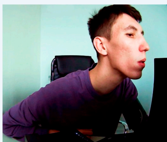
Проверка на наличие алкоголя