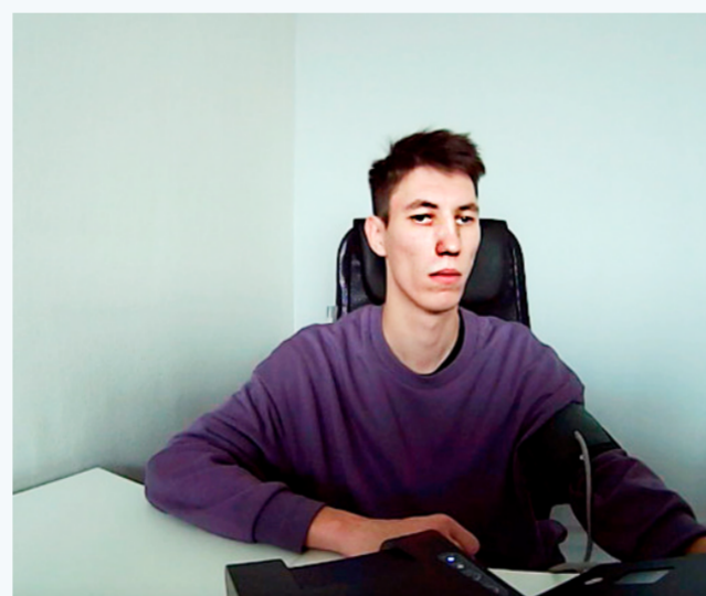
Измерение давления и пульса

Тестовый Водитель Компании прошел предрейсовый медицинский осмотр к исполнению трудовых обязанностей допущен 06-09-2023 13:44:29 (МСК) Медработник: Тест_Проверка Медика Тестовое представительство Лицензия №_ТестоваяЛицензия от 10-10-2020 г., бессрочно УКЭП 8ВВ5904375А359Е4 Осмотр № 1 6664633 МЕДБАНК.РФ